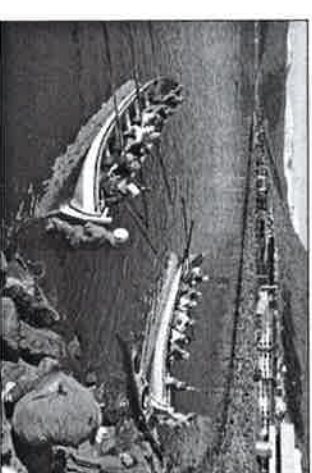
Frá árlegri róðrarkeppni MÍ í haust