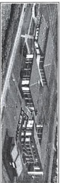
Byggingar Mentaskólans á Ísafirði

Þessi áhersla á bóknaði er umhugsunar-efni, því það vill stundum gleymast að það er fleira menntun en bóknað. Verknám er