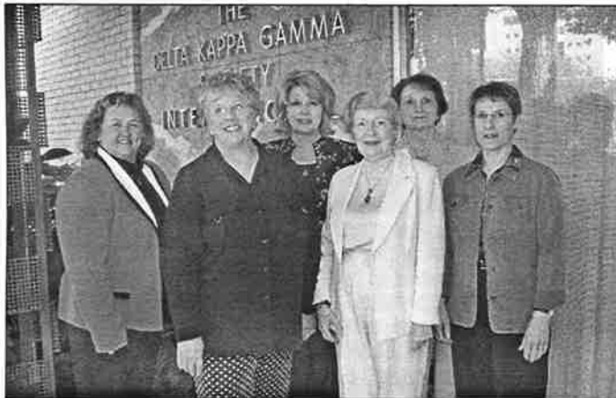
Nefndin fyrir framan Höfuðstöðvarnar í Austin

Formaðurinn setti svo saman nýjan forgangslista úr listum nefndarkvænna og með þann lista var unnið þegar nefndin hittist á árlegum tveggja daga fundi í höfuðstöðvunum, en fundurinn er ákveðinn með árs fyrirvara og verður síðari fundur nefndarinnar dagana 7.–8. apríl á næsta ári. Undirbúningur fundarins var mjög góður og var athyglisvert að kynnst þeim vinnubrögðum sem beitt var. Hver nefndarkona sagði skoðun sína á þeim fimm bókum sem hún hafði valið og hvers vegna hún valdi og forgangsraðaði viðkomandi bók með þeim hætti sem hún gerði. Síðan voru allar bækurnar ræddar fram og aftur og haldið áfram að forgangsraða þar til samkomulag náðist um hvaða bók ætti að tilnefna í ár. Það er margra sjónarmiða að gæta, t.d. um það hvort bókinni eigi aðeins að uppfylla þá kröfu að tengjast menntun og vera líkleg til þess að hafa áhrif á skipulag skólastarfs, nám og kennslu með einhverjum hætti eða hvort efni hennar þurfi að höfða sérstaklega til sem flestra félagskvænna svo dæmi sé tekið. Sitt sýndist hverjum um þetta.