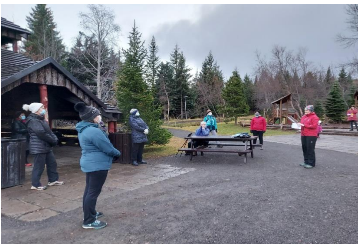
Stoppað var reglulega og hlýtt á ljóð um haustið og náttúruna eftir valdar konur.

Ljóst var að vetrardagskráin var sett saman meira af óskhyggju en raunsæi. Undirbúnings-hópur fundar okkar í október fann frábæra lausn og þann 28. október örkuðu Beta-systur um Kjarnaskóg með grímur og 2 metra á milli.