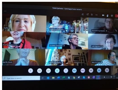
Fjarfundiformið gekk vel og við allar að læra og prófa okkur áfram.

Við reyndum að halda í okkar meginhefðir og höfðum rósavönd á sínum stað og kveiktum á kertum sem skinu á fallegan bakgrunn rétt eins og í myndveri. Við létum okkur þó nægja rafrænar rósir sem þakklætisvott.