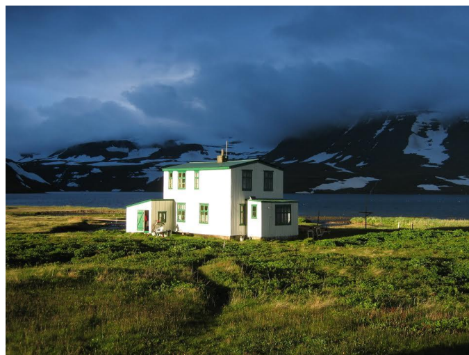
Læknishúsið eins og það blasir við gestum sem heimsækja Hesteyri.